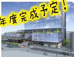
北口新駅ビルのイメージ図